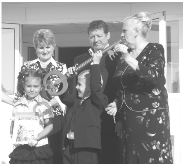
Elevii clasei I primind cheia cunoștințelor

elevii ce vin în clasele întâi totul e necunoscut acum, însă nu va trece nici o lună și ei deja vor zburda pe culoarele școlii „ca la ei acasă”. Atenția principală a fost îndreptată spre ei desigur, micuții din clasa I, care și-au ocupat locul de cinste, trecând prin podul de flori pregătit de cei, pentru care primul sunet e și ultimul în școala natală – clasa XI. Absolvenții le-au urat mult succes și le-au înmănat cheia simbolică a cunoștințelor, pe care „picii” abia de o țineau.