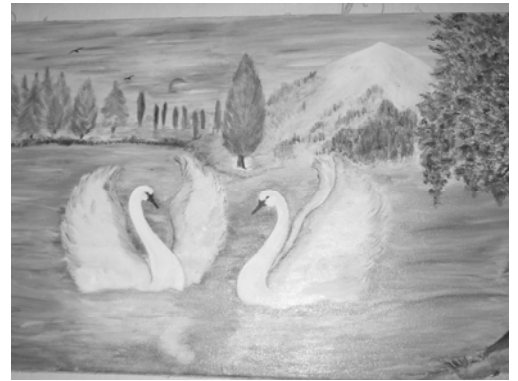
Primul tablou în ulei

fabulos spre cer erau identici cu cei imaginați de pictoriță cu mult timp înainte, ceea ce denotă o legătură deosebită între ea și natura înconjurătoare. Uneori regăsește inspirație în propriile vise iar în momente de lipsă a unei muze, familia este cea care o încurajează și o îndeamnă la noi creații. Alteori surse de inspirație